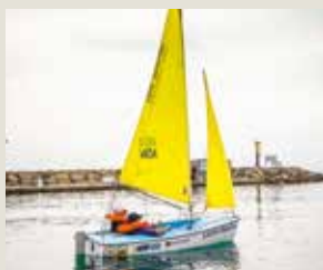
Page de couverture : Activité handi voile à Hyères

Magazine de l'association Les Auxiliaires des Aveugles, reconnue d'utilité publique en 1974.