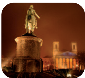
Page de couverture

La Place Napoléon