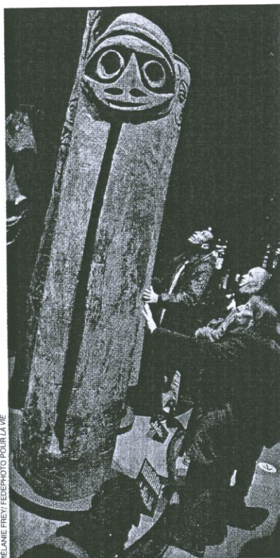
Toucher les œuvres permet de mieux les imaginer et d'accéder à l'émotion que procure l'art, même sans voir.

Ils sont une vingtaine à avoir fait le déplacement, dont une dizaine d'accompagnateurs de l'association les Auxiliaires des aveugles. « J'ai déjà effectué de nombreuses sorties dans les musées. Mais, jusqu'à présent, on se contentait de nous décrire les œuvres avec des mots. Le fait de pouvoir les toucher change tout, car on arrive à les visualiser davantage. On peut vrai-